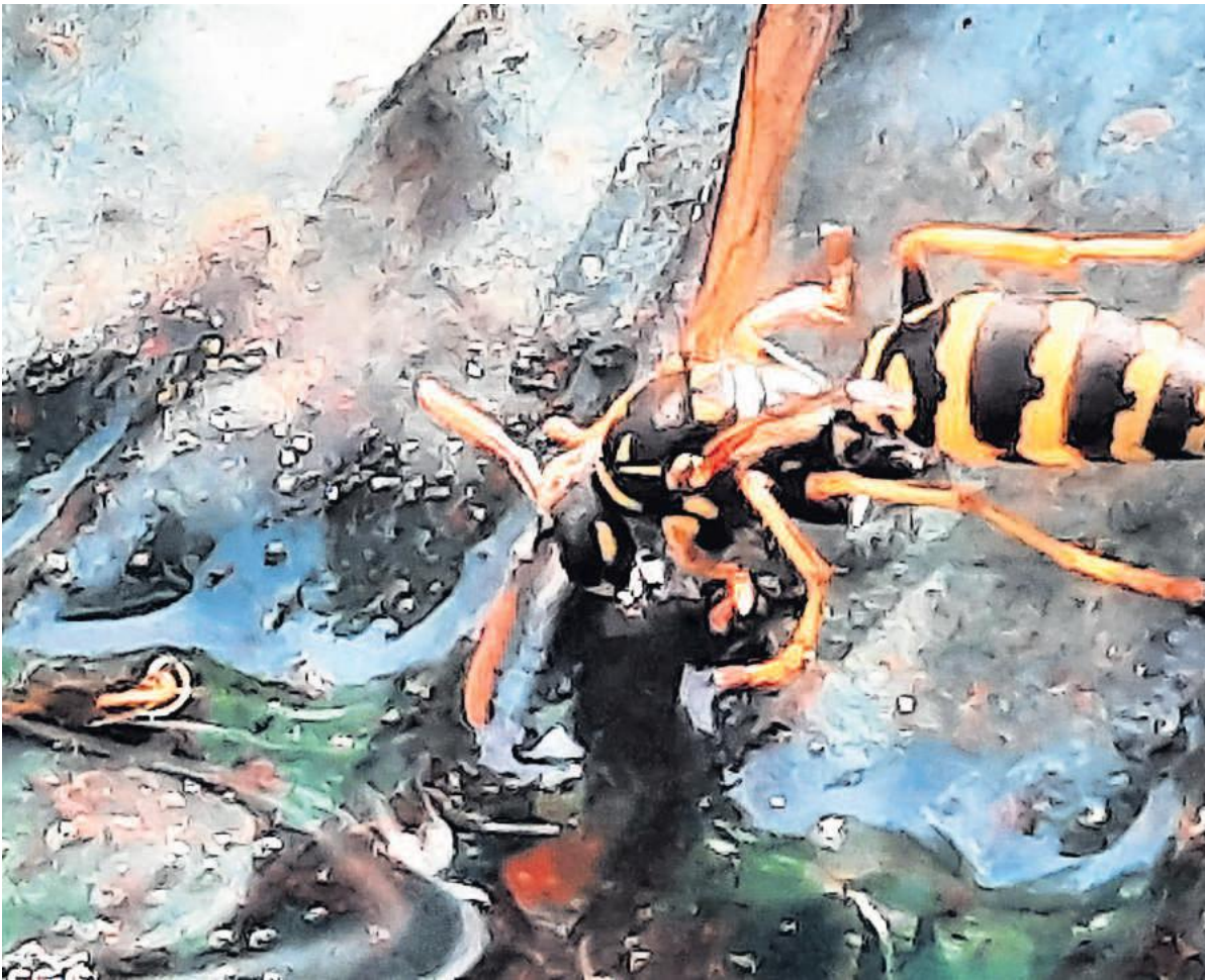
Deze wesp laaft zich aan het water in het vogelrinkbakje. Theo Leferink

Ook in deze rubriek? Mail uw foto naar steenwijkercourant@mediahuisnoord.nl