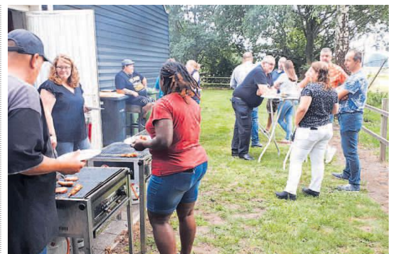
De bbq tijdens het dorpsfeest in Onna. Aangeleverde foto