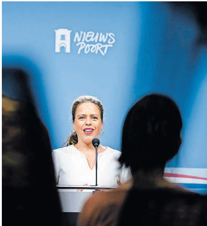
Carola Schouten, minister voor Armoedebeleid, Participatie en Pensioenen en vice-premier, staat de pers te woord na afloop van de wekelijkse ministerraad.

Dit is een duidelijke trendbreuk met het neoliberale hardvochtige beleid dat is ingegeven door wantrouwen. Daar wil het kabinet van af. Nu mogen mensen met een bijstandsuitkering geen activiteiten ondernemen die met geld kunnen worden gwaardeerd. Het gaat bijvoorbeeld om schoonmaken bij de bureaus of spulletjes verkopen via Marktplaats. De uitvoering van de regels ver-