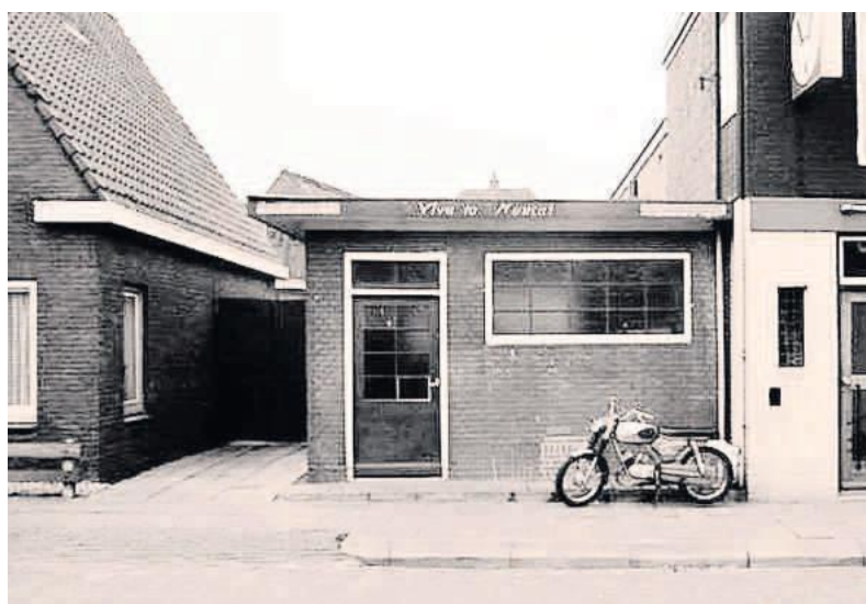
‘Viva la Musica’. Historische Vereniging Steenwijk e.o.

Voor de talrijke treffende bewijzen van belangstelling en achting, die hij op den 16en dezer, den dag van zijn 50-jarig ambtsjubileum mocht ontvangen, betuigt ondergeteekende, mede namens zijn Familie, zijn oprechten dank. D. v. D. HEIDE.