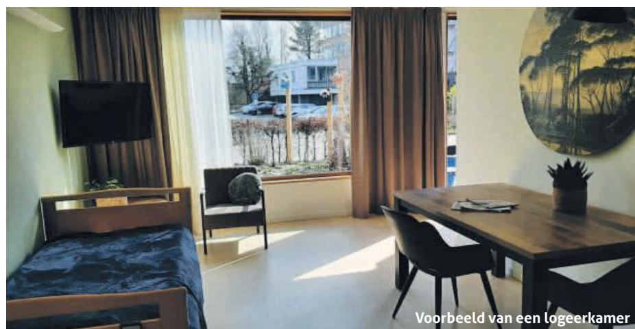
Voorbeeld van een logeerkamer

Er kunnen verschillende redenen zijn waarom u de zorg voor uw naaste tijdelijk moet overdragen. Misschien omdat u ziek bent of op vakantie wilt. Om uit te rusten, andere mensen te zien of andere dingen te doen dan zorgen. Dat kan echter alleen als u de zorg op een verantwoorde manier kunt overdragen.