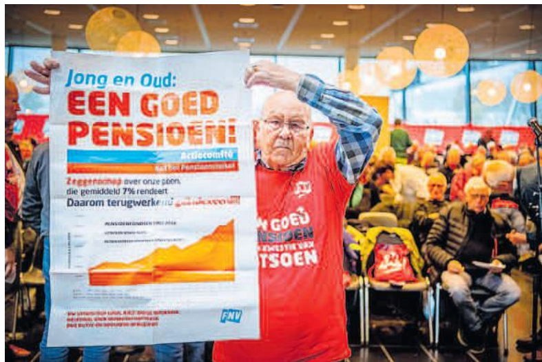
Belangstellenden tijdens een actiebijeenkomst van de FNV over pensioenen in 2018.

Jarenlang werd er geroepen dat wij het beste pensioenstelsel ter wereld hebben. Dat klopt, dat hebben we ook. Een paar jaar geleden werd ons verteld dat ons pensioenstelsel niet meer van deze tijd is en dat we moeten veranderen. Waarom werd er niet bij gezegd. Er werd iets geroepen over de jeugd, persoonlijke potjes, zware beroepen en indexeren. Als je iets maar vaak genoeg roept, gaat iedereen het geloven en hoef je niets meer uit te leggen. Voor alles wat er geroepen werd, hoef je geen nieuw pensioenstelsel op te tuigen, dit kun je allemaal regelen met een paar aanpassingen van het huidige stelsel. Pak als eerste de rekenrente aan, laat de pensioenfondsen rekenen met het daadwerkelijk behaalde rendement en de