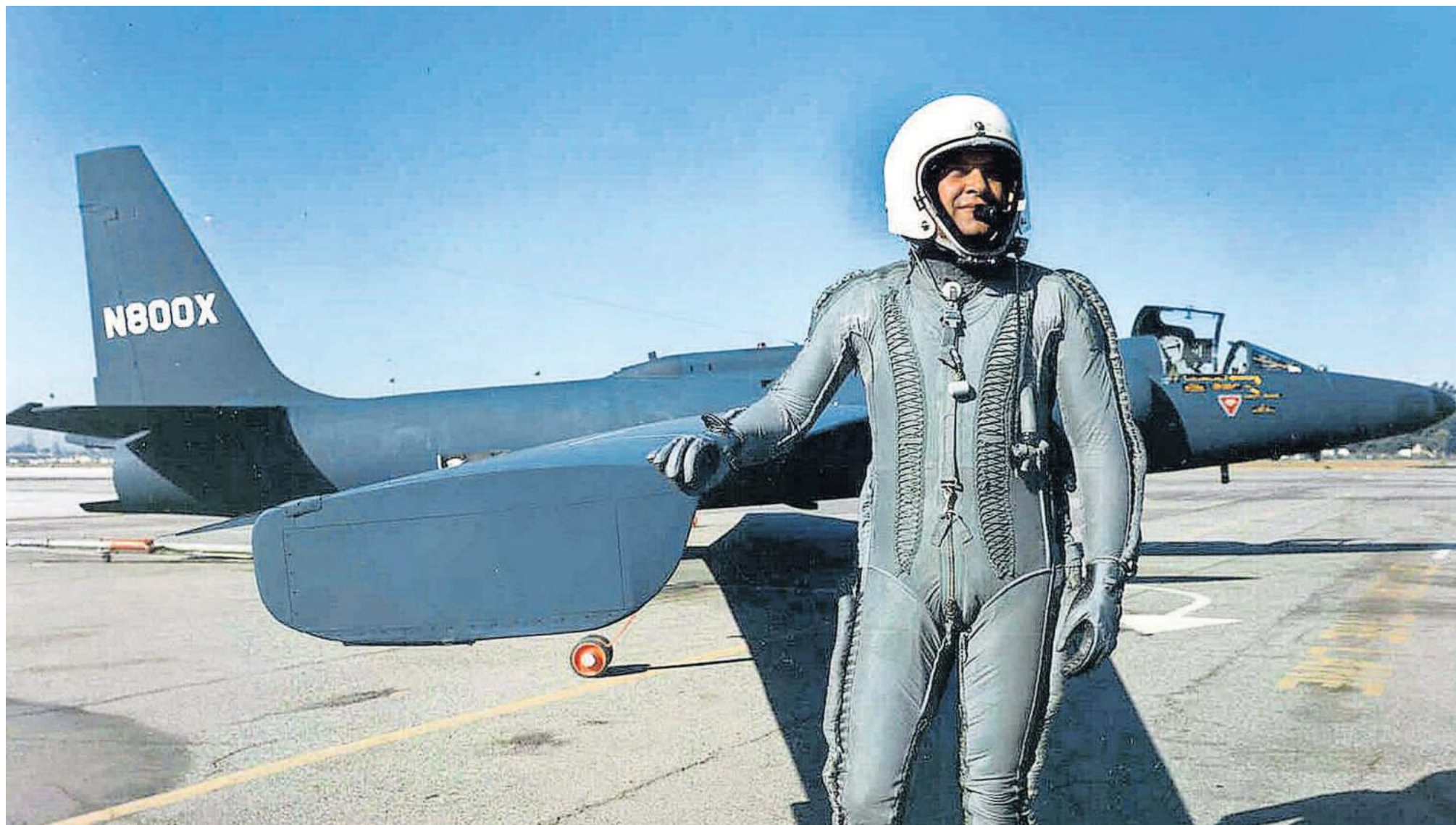
Gary Powers gefotografeerd voor zijn U-2. Het legendarische spionagevliegtuig kon een hoogte bereiken van ruim 21 kilometer. Amerikaanse luchtmacht