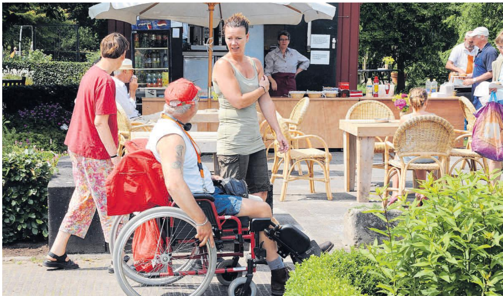
De open dag van de gehandicapentuin.