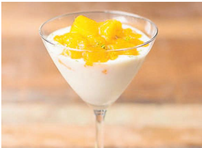
Simpele mango-fool met yoghurt en kardemom.

Doe de blokjes mango met de kardemom en 235 milliliter water in een steelpannetje. Als je hele, verse mango's gebruikt, kun je zelfs de pit erbij doen. Het vruchtvlees laat door de hitte los van de pit. Breng het aan de kook, zet het vuur laag en laat ongeveer 20 minuten sudderen. Wat je wil, is een