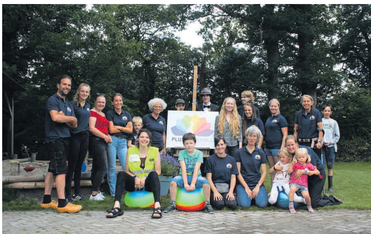
Het was zaterdag druk bij de Plus Boerderij in Wapserveen.

Het twintigkoppig team van medewerkers bestaat uit medici (arts, verpleegkundige), wetenschappers (orthopedagoog, bewegingswetenschapper) en soci-