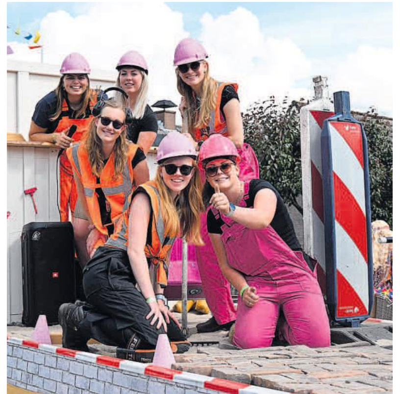
De winnende versierde wagen was 'Vrouwen die Bouwen'.

In Oosteinde was er mede door het thema beperkte actualiteit, maar de apenpokken kwamen uiteraard voorbij, net als ABBA Gold, een verwijzing naar de wederopstanding van de bijna bejaarde Zweedse supergroep uit de zeventiger en tachtiger jaren. De wagen was echter door vier jonge meiden bedacht, een bewijs dat die muziek eeuwigheidswaarde heeft. Bij de schoolwagens won die van Max Verstappen. Veel Flower Power met kleuren, bloemen en smoothies. Edwin Weide vatte het begrip power iets