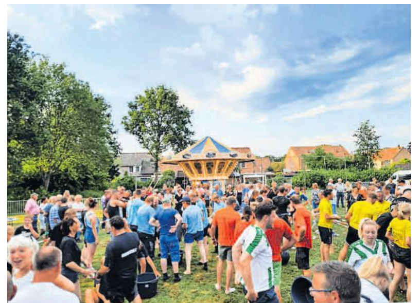
Het dorpsfeest werd goed bezocht.